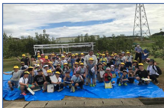
▲緑丘小学校の児童が、柿栽培を学習